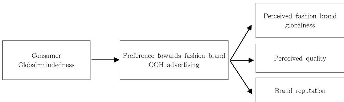
<Fig. 1> Research Model

지각된 패션 브랜드의 글로벌성은 브랜드가 여러 국가에서 판매 활동을 하고 있고 일반적으로 글로벌하다고 인식되어 있음을 소비자들이 믿고