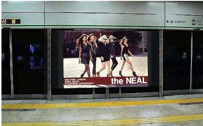
<Fig. 2> Priming image

AMOS 7.0 프로그램을 사용하여 추출된 요인들의 타당성을 검증하기 위한 확인적 요인분석을 실시하고 가설모델 검증 및 모델의 적합도를 측정하기 위하여 구조방정식모형 분석을 실시하였다.