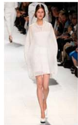
<Fig. 11> 2015 S/S Issey Miyake (fisrtview, n.d-d)