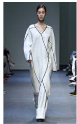
〈Fig. 7〉 2015 F/W Low Classic (lowclassic, n.d-a)