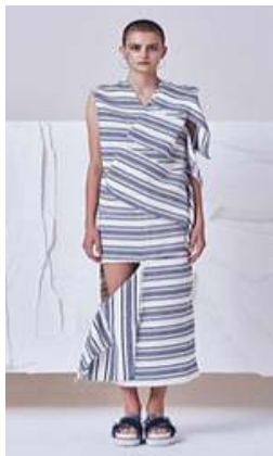
〈Fig. 5〉 2017 S/S Soulpot Studio (soulpotstudio, n.d-a)