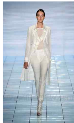
<Fig. 10> 2015 S/S LIE SANGBONG (fisrtview, n.d-c)