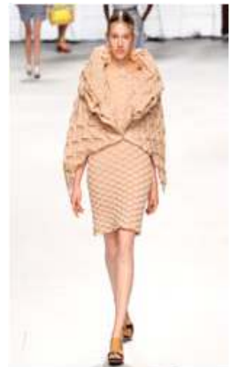
<Fig. 15> 2015 S/S Issey Miyake (firsrtview, n.d-f)