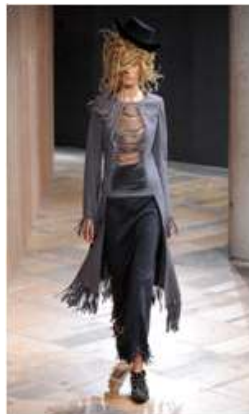
<Fig. 13> 2014 S/S Junya Watanabe (firsrtview, n.d-e)