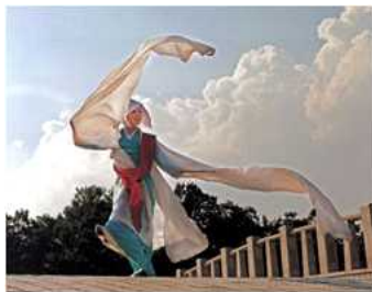
<Fig. 2> Buddhist Dance [Seungmu] (naver, n, d-b)