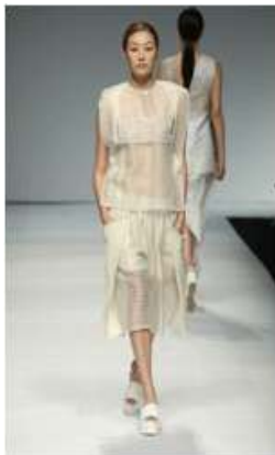
<Fig. 12> 2015 S/S SoulPot Studio (soulpotstudio, n.d-c)

현대 패션에 나타난 정중동의 표현 중 조화에 의한 상호 관계적 표현은 정중동의 특성인 유희적 상호 관계적 표현과 같이 착용자와 관찰자에 의해 가지게 되는 내재적 의미는 다를 수 있으나, 서로 상호 교류할 수 있는 형태적 표현으로 차용되어 나타남으로써 정중동의 성격 중 중의 성격인 중용