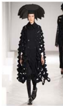
〈Fig. 6〉 2015 F/W Junya Watanabe (firstview, n.d-b)