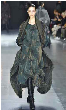
〈Fig. 4〉 2016 F/W Issey Miyake (firstview, n.d-a)