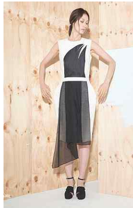
<Fig. 14> 2016 S/S Soulpot Studio (soulpotstudio, n.d-d)