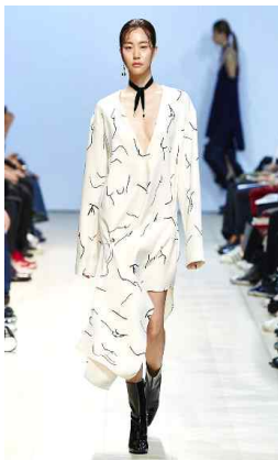
<Fig. 8> 2016 S/S Low Classic (lowclassic, n.d-b)

정중동의 마지막 특성인 창작자와 관람자 사이의 상호 교류를 통해 나타나는 유희적 상호 관계성은 현대 패션에서 색채와 소재의 대비의 조화를