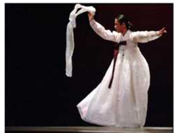
<Fig. 3> Exorcism Dance [Salpurichum]