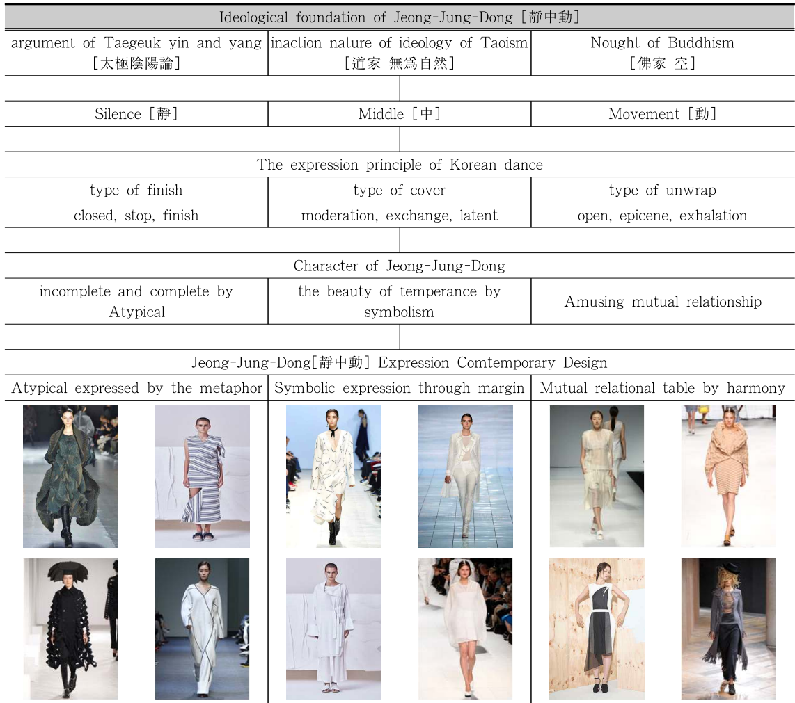
<Table 2> The Jeong-Jung-Dong[Movement in Silence] Expression Comtemporary Design