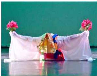
<Fig. 1> Butterfly Dance [Nabichum] (naver, n, d-a)

자연미의 추구를 최우선으로 지향하는 한국춤은 무용수의 연륜을 통해 흥(興)과 신명(神明),