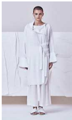
<Fig. 9> 2017 S/S Soulpot Studio (soulpotstudio, n.d-b)