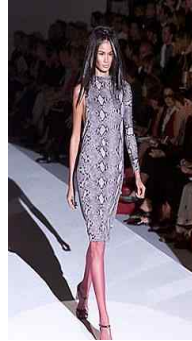
<Fig. 3> Gucci 2000S/S