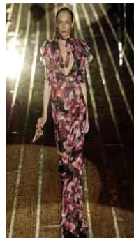
<Fig. 7> Gucci 2006S/S