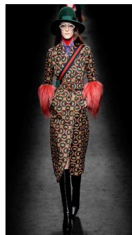
<Fig. 11> Gucci 2016F/W