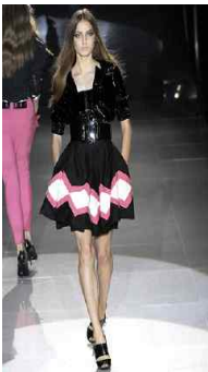
<Fig. 5> Gucci 2008S/S