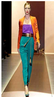
<Fig. 6> Gucci 2011S/S (Firstviewkorea, n.d.-f)