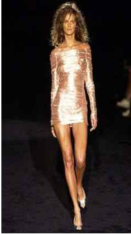
<Fig. 1> Gucci 2003F/W (Firstviewkorea, n.d.-a)