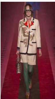
<Fig. 9> Gucci 2017S/S (Firstviewkorea, n.d.-i)