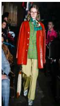
<Fig. 10> Gucci 2019S/S (Firstviewkorea, n.d.-j)