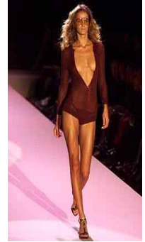
<Fig. 4> Gucci 2002S/S