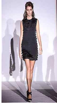
<Fig. 2> Gucci 2001F/W