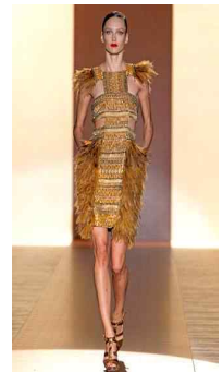
<Fig. 8> Gucci 2011S/S (Firstviewkorea, n.d.-h)