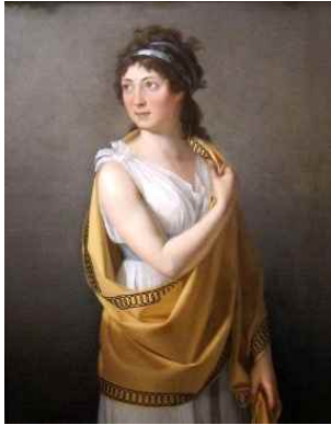
<Fig. 8> Portrait of a Lady Marie-Guillemine Benoist, c.1799 (Lowery, 2019. p. 269)