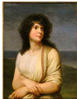
〈Fig. 6〉 Madame Hamelin, c.1798 (RMN-Grand Palais, n.d.-b)