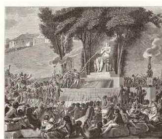
〈Fig. 2〉 Festival of the Regeneration of Nature, Paris, 10 August 1793 (Héricault, 1883, p. 167)