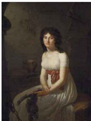
〈Fig. 5〉 Citizen Tallien in a Cell in La Force Prison, c.1796 (Rausser, 2020. p. 164)