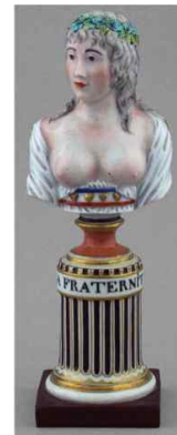
〈Fig. 3〉 Manufacture de Niederviller, Fraternity, ca.1794-95 (Freund, 2014, p. 215)