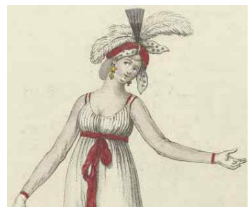
<Fig. 12> Costume Parisien, Fichu, c.1797 (Rauser, 2020, p. 179)