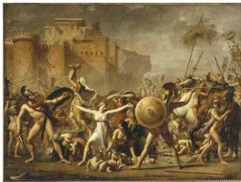
〈Fig. 1〉 Les Sabines, c. 1799 (RMN-Grand Palais, n.d.-a)

메르베이의즈의 복식은 이러한 근대 모성을 지향했던 사회적 요구와 개인의 해방감의 심리가 결합된 결과이다. 혁명이 발발하고 공포정치 기간에 이르기까지 여성들은 표현의 자유가 억압된 공포심 속에서 앙시앵 레짐 시기의 여성상에서 벗어난 모습을 사회에 노출 시켜야 했다. 하지만 공포정치가 끝난 후 사회 표현을 억압하던 분위기가 완화됨으로써 여성은