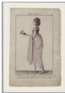
<Fig. 11> Costume parisien, c.1797