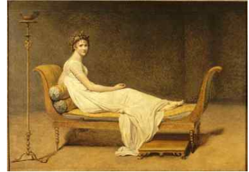
<Fig. 9> Portrait of Madame Récamier, c.1800

로베스피에르(Robespierre)에 의해 더욱 더 권장되었다. 로베스피에르는 육체를 성적 매력이 없거나 주목할 만한 것으로 만들기 위해 어떤 장식적 요소도 착용하지 않게 하여 육체를 중립화 하였으며, 이제 시민들은 중립화된 육체로 인해 외부의 이견 없이 서로 상대할 수 있는 자유를 갖게 되었다(Sennett, 2017).