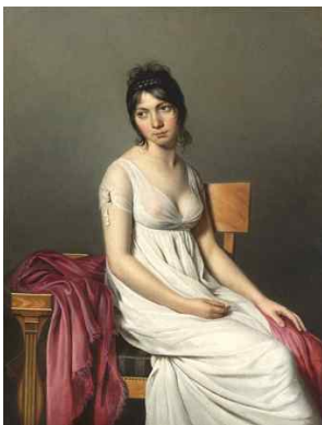
〈Fig. 4〉 Portrait of a Young Woman in White (National Gallery of Art [NGA], n.d.)

혁명에 있어 복식은 자신의 정치적 입장을 시각화하는 매체였으며 복식을 통해 사치를 과시하는 행위는 지양해야 하는 것이었다. 혁명 후 의상에서 추구된 단순함(simplicity)은 앙시앵 레짐 시대의 몸의 인식에서 탈피하고자 하는 가치였다. 혁명 전 여성의 몸은 레이스(lace)와 자수(embroidery)가 가득한 브로케이드(brocade), 타프타(taffeta), 실크(silk), 다마스크(damask) 종류의 직물 그리고 장인의 손재주를 황홀하게 선보이는데 필요한 일종의 마네킹(mannequin) 역할이었다. 혁명은 이러한 몸의 마네킹 역할로부터 독립을 이끌어냈다(Geczy, 2013). 혁명 이후 앙시앵 레짐의 독특하고 풍부하며 화려했던 복식의 특성은 도덕적 파멸을 상징하는 것으로 여겨졌으며, 새로운 시대에 맞춰 더욱 엄격하고 겸손한 복장이 요구되었기 때문이다(McIlvanney, 2019). 당시 사람들은 계몽주의 정신에 입각하여 복식의 과시 행위를 지양하고 단순함을 추구함으로써 몸을 인식하는 방법을 변화시키고자 하였다. 이는 몸을 인식하는데 있어 변화가 수반됨으로써 구체제 시대와 같이 복식을 전시하기 위한 마네킹으로서의 인간이 아닌, 복식을 착용하는 사람으로서 살아있는 인체 그 자체에 집중할 수 있도록 한 것이다. 또한 단순함은 공포정치 기간 동안