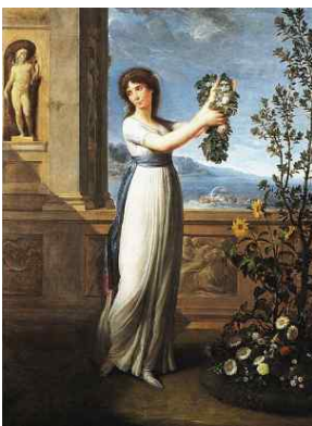
<Fig. 10> Joséphine as Venus by Andrea Appiani, c.1796 (Bietoletti, 2009, p. 64)

나 체형 조정물과 같은 물리적인 것으로부터 자유로워져 몸을 노출하고 자연스러움을 찬미하며 최소한의 의상만을 걸치고 자연스럽게 근대 사회의 산책로를 활보하였다. 공포정치기간 동안 억눌려 있던 신체를 자유롭게 움직이고 화려하게 보일 수 있는 자유에 대한 아이디어가 등장한 것이다(Uzanne, 1887). 사치스러운 복장에 대해 제약이 없던 총재정부 시기는 사람들 그 스스로 매우 방탕할 만큼 우아한 미의 고전적 양식을 모방하는 걸치레 문화를 발산 시켰다(Geczy, 2013).