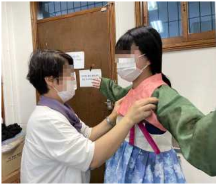
〈Fig. 3〉 Hanbok Outfit Inspection (2022.08.26)