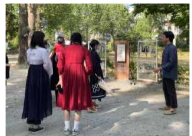
<Fig. 7> Try-on and Field Study Experience in 2023-Spring Semester