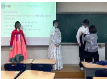
<Fig. 5> Try-on Experience in 2023-Spring Semester

시음 행사는 근대 생활 속 음식을 다루는 주차의 체험 행사로, <Fig. 9>와 같이 바리스타를 초빙하여 근대 시기 커피인 양탕국을 제조하고 시음해 보는 프로그램을 기획하였다. 이와 함께 근대 시기에 새롭게 도입되어 인기를 끌었던 우유와 단팥빵도 먹으면서 좀 더 흥미롭게 강의 내용을 이해해보는 시간을 마련하였다.