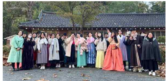
<Fig. 8> Try-on and Field Study Experience in 2023-Fall Semester

건축물을 답사하는 형식으로 진행되었다. 학생들 각자 원하는 한복을 골라서 착용한 후 한남대학교 내에 있는 선교사촌을 방문하여 근대 건축물로서의 의미를 알아보며 해당 공간에서 자유롭게 사진을 찍는 시간을 마련하였다. 학생들이 한복을 입고 교내를 돌아다니는 과정을 통해 다른 학생들도 자연스럽게 한복 및 본 교과목에 관해 관심을 갖게 되는 홍보 효과가 나타나기도 했다.