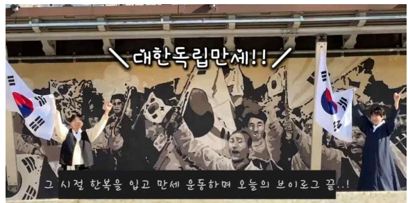
<Fig. 11> V-log Video Produced in 2023-Fall Semester