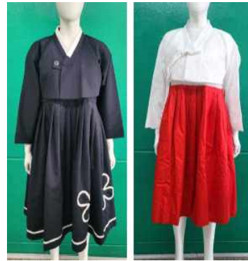
〈Fig. 4〉 Hanbok Produced Additionally in 2023 (Photo by Author, 2023)

서 보완이 필요했던 품목 30벌을 추가로 제작하였다. 여학생 교복 형태가 선호도가 높아 여러 벌을 더 제작하였으며, 외국인 유학생의 체형을 고려하여 좀 더 다양한 치수를 구비할 수 있도록 하였다. 또한 기온이 낮아지는 2학기 수업에서의 체험 시기에 대비하여 방한용 복식을 추가로 제작하였다. 〈Fig. 4〉는 추가로 제작한 한복 중 일부이다.