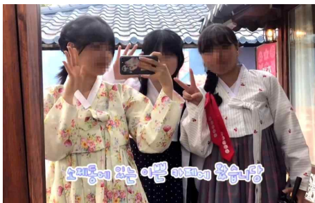
<Fig. 10> V-log Video Produced in 2023-Spring Semester

기말시험은 지필 고사로 시행하였으며, 이론 강의 내용에 대한 학생들의 이해도를 평가하였다.