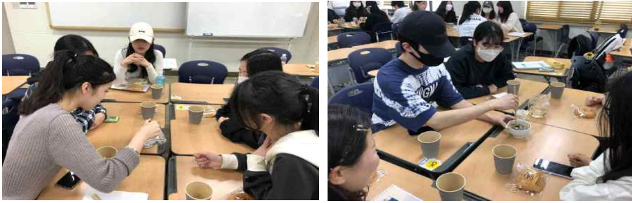
<Fig. 9> Yangtangguk Making and Tasting Experience in 2023-Spring Semester