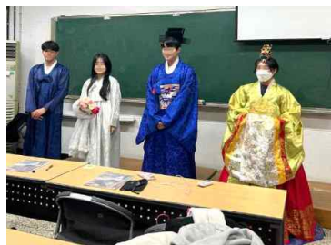
<Fig. 6> Try-on Experience in 2023-Fall Semester