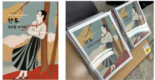
<Fig. 2> Course Textbook(2023-Fall Semester)

수업 진행과 학생들의 이해를 돕는 방향으로 교안의 내용을 수정, 보완하였다. <Fig. 2>와 같이 교안의 표지를 직접 디자인하였는데, 매 학기 새로운 디자인을 적용하였다.