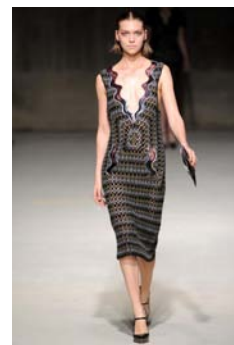
〈Fig. 13〉 Inspiration-Unique Textile (VOGUE, n.d.-m)