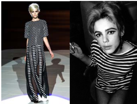
〈Fig. 1〉 Inspiration-Edie Sedgwick (left-VOGUE, n.d.-a, right-Found a Grave, n.d.)