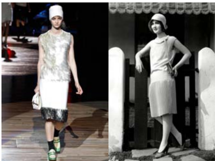
〈Fig. 3〉 Inspiration-1920s (left-VOGUE, n.d.-c, right-Leaper, 2015)

자연물 카테고리에서 영감의 종류는 포괄적인 개념으로서의 자연, 바다, 물, 땅, 달과 태양 등 자연 환경과 나무, 꽃, 벌, 새 등의 동식물을 포함하였다. 디자인 영감을 표현하는 방식으로는 주로 대상의 색채적인 요소를 활용하여 유사성을 나타내는 발상이 많았으며, 일정한 형태가 없는 대상의 모습을 패턴화하여 무늬로 활용한 디자인, 대상의 특징적인 형태나 일부분에 집중하여 디테일로 활용한 디자인, 대상의 형태를 그대로 프린트하여 모티프로 사용한