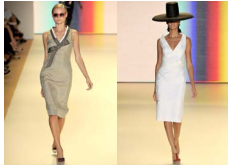
〈Fig. 4〉 Inspiration-Traditional Clothes of Korea (VOGUE, n.d.-d)