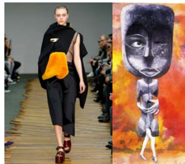
〈Fig. 2〉 Inspiration-Artworks of Hannah Hoch (left-VOGUE, n.d.-b, right- Hoch, 1926)

의 색채나 형태 같은 디자인 요소에서 특징적인 부분을 추출하고 변형하여 추상적으로 영감을 표현한 예 등이 있었다.