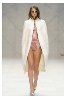
〈Fig. 9〉 Inspiration-Corset and Cape (VOGUE, n.d.-i)