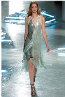
〈Fig. 5〉 Inspiration-Ocean (VOGUE, n.d.-e)