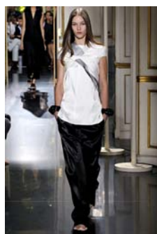
〈Fig. 8〉 Inspiration-Togetherness (VOGUE, n.d.-h)