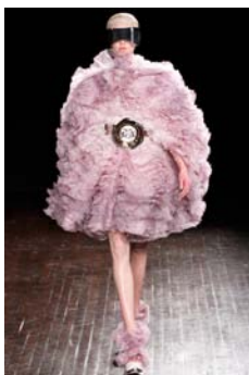
〈Fig. 11〉 Inspiration-Optimism (VOGUE, n.d.-k)

〈Fig. 13〉은 인공물에서 영감을 얻은 2011 F/W 시즌 Christopher Kane 컬렉션의 디자인이다. 크로세 기법을 활용한 뜨개질 패턴과, 네크라인과 포켓의 곡선 장식으로 인해 디자인 요소 중 선의 활용이 눈에 띄나, 이 컬렉션에서 디자이너는 무엇보다도 ‘독특한 소재’의 활용에 집중하였다. 플라스틱 재질의 곡선 장식 안에는 특수한 오일이 들어있으며,