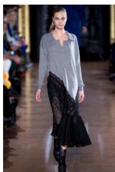
〈Fig. 7〉 Inspiration-insert the feminine into the masculine (VOGUE, n.d.-g)

디자인 요소 중 선을 이용하여 컬렉션의 주제나 영감의 원천을 강조한 경우, 외부의 선인 실루엣을 이용한 예로 과장되거나 기하학적인 실루엣으로 디