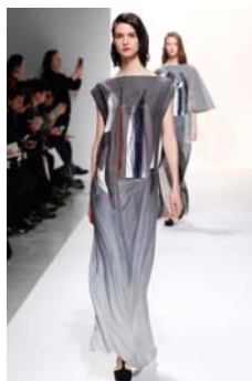
〈Fig. 12〉 Inspiration-Cosmetics (VOGUE, n.d.-l)