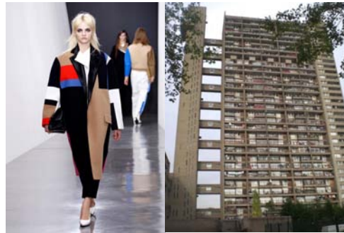
〈Fig. 6〉 Inspiration-Trellick tower (left-VOGUE, n.d.-f, right-Sones, R., 2009)