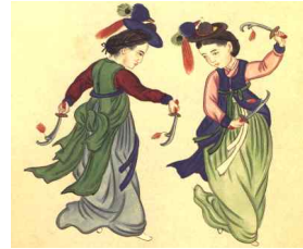
〈Fig. 35〉 Gisaeng(妓生) Jeonbok(戰服) Late19C (The Korean Christian Museum at Soongsil University collection)

이 앞길을 나란히 하여 전대로 고정하나 무너는 〈Fig. 5〉, 〈Fig. 10〉, 〈Fig. 18〉, 〈Fig. 24〉에서처럼 앞길을 짓혀 전대로 묶은 것을 볼 수 있는데 굽을 하는 동안 환복(換服)을 하는 특성상 제대로 갖춰 입지 못하므로 의복의 착장형태에 대해서는 크게 신경을 쓰지 않는 것을 알 수 있다. 복색은 군인과 무녀 동다리 모두 소매가 붉고, 몸판의 전복은 흑색으로 차이가 없다.