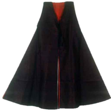
〈Fig. 33〉 Jeonwonyong's Jeonbok(戰服) (The National Folk Museum of Korea Collection)