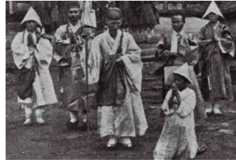
〈Fig. 27〉 Buddhist monk 1904 (Hamilton, 2000)

로 그 일습은 백색 고깔, 백색 장삼, 붉은색 대(帶)와 가사(袈裟)이며 이는 승려의 복장과 같다. 장삼은 불교에서는 승려의 법복(法服)이고 궁중에서는 왕실 비·빈부터 나인까지 착용했던 예복이다. 승려의 장삼은 불교가 인도에서 중국으로 넘어가며 개조된 옷으로, 불교사전에는 '소매가 매우 넓고 허리에 여분을 두고 큼직한 주름을 잡은 승복으로 윗옷인 편삼(偏衫)과 아래도리인 군자(裙子)를 합쳐 꿰맨 옷'(Kwak, 2003)이라 쓰여 있다.