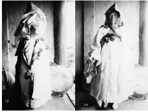
〈Fig. 26〉 Jangsam(長衫) 1911 (National Museum of Korea, 1997, p. 27)