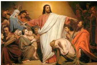
<Fig. 1> Ary Scheffer. (1837). Christus Remunerator. ( https://fineartphotographyvideoart.com )

이러한 굿은 지역과 무당마다 순서에 차이가 있으나 대부분 '굿판을 정화하고, 여러 신을 청배 후, 주요 신을 모시고, 액을 막고 복과 평안을 빌며, 끝으로 잡신을 풀어먹여 마무리'하는 순서로 진행된다. 여기서 신을 모셨다 돌려보내는 것은 유·불교의 제사와 유사해 보이나 유·불교의 경우 제사 중 주재자 복식이 교체되지 않지만 무속은 주재자인 무당의 복식이 각 거리마다 교체되므로 무속 제사에서 복식은 중대한 역할을 할 것임