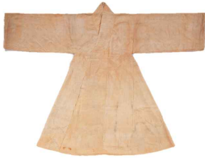
〈Fig. 36〉 Juui(周衣) 19C (Gyeonggi Provincial Museum collection)