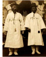
〈Fig. 37〉 Juui(周衣) 1920s (The National Folk Museum of Korea collection)

조선후기 남자 두루마기 형태는 이연응(金德遠, 1818~1879)의 복식유물(Fig. 36)과 일제강점기 기록 사진(Fig. 37)에서 착용모습을 볼 수 있는데 착수(窄袖)에 직령교입의 포로 『무당내력』에서 무녀가 착용한 두루마기(Fig. 12), 〈Fig. 20〉와 비슷한 형태이다.