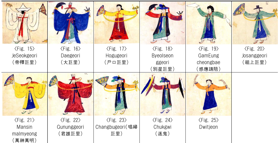
<Table 2> 11 tunes of the 『Mudangnaeryeok』(Garam古 398.3-M883)

『Mudangnaeryeok』(NanGok, Seo, & Kyujanggak, 2005), pp.51~63