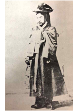
〈Fig. 32〉 Gugunbok(軍服) Late19C (Seok, 1985, p. 425)

당상관은 남색, 당하관은 홍색(Im, 1996)이었는데 곳에서도 이와 마찬가지로 대거리의 최영장군과 같이 높은 신격을 표현할 때는 청색철릭을 착용하 고, 그보다 낮은 구릉거리의 장군신을 표현할 때 는 홍색철릭을 착용해 같은 신이지만 신격과 중요 도에 따라 복색을 구분해 착용했음을 알 수 있다.