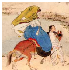
〈Fig. 39〉 Gisaeng(妓生) Jangui(長衣)1 (Kansong Art Museum collection)