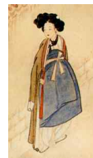
〈Fig. 40〉 Gisaeng(妓生) Jangui(長衣)2 (Kansong Art Museum collection)