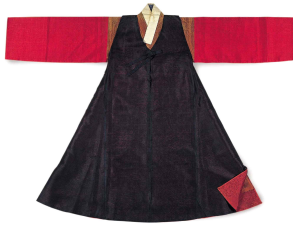
〈Fig. 31〉 Jeonwonyong's Gugunbok(軍服) (The National Folk Museum of Korea collection)