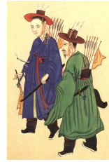
〈Fig. 29〉 general Late19C (The Korean Christian Museum at Soongsil University collection)

광다회 또는 홍색 철릭에 청색 광다회이며 이는 군인의 용복과 같다. 이러한 철릭은 앞서보았던 장삼과 같이 상의하상(上衣下裳)을 허리에서 연결한 원피스형의 남자 포로 첩리(帖裏, 貼裏)·천익(天翼)으로도 불린다. 철릭은 군사들에게 용복으로 착용 17) 18) 19) 20) 됐으며, 초기에는 『악학궤범』에서 볼 수 있듯 소매가 좁고 상의(上衣)가 길게 제작되었으나 이후 상하비율, 하상의 폭, 소매너비가 변하여 후기 21) 에는 옛 제도와 달리 소매를 비단 폭 그대로 사용할 정도로 커진 것을 알 수 있다.