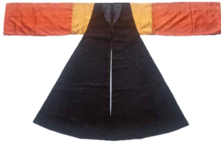
〈Fig. 30〉 Yunyonggu's Dongdari(同多里) (Dankook University Seokjuseon Memorial Museum collection)