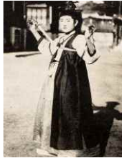
〈Fig. 34〉 Gisaeng(妓生) Jeonbok(戰服) Early20C (Imamura, 1930)