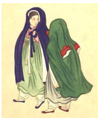
〈Fig. 38〉 Jangui(長衣) Late19C (The Korean Christian Museum at Soongsil University collection)

그러나 착장방법에 있어서 일반 장옷의 경우 〈Fig. 38〉, 〈Fig. 39〉과 같이 얼굴을 깃으로 감싸